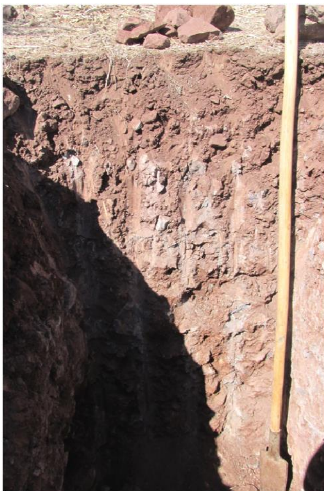
Fotografía 1: Ejemplo 1 de calicata estándar.

En contraposición a lo anterior, la autoridad (CORFO, SAG) manifiesta la necesidad de realizar sondeos que representen el terreno y que posean 1 metro cúbico aproximado como estándar para un apropiado análisis y caracterización 4 . En las Fotografías 1 y 2 se exponen ejemplos de calicatas representativas de lo solicitado en las diversas guías metodológicas consultadas.