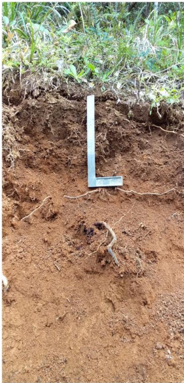
Fotografía 2: Ejemplo 2 de calicata estándar.